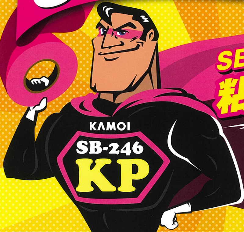
「SB-246KP」のサイディングボード貼り付け比較試験